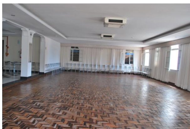
Visual interna do salão. Piso de tacos.