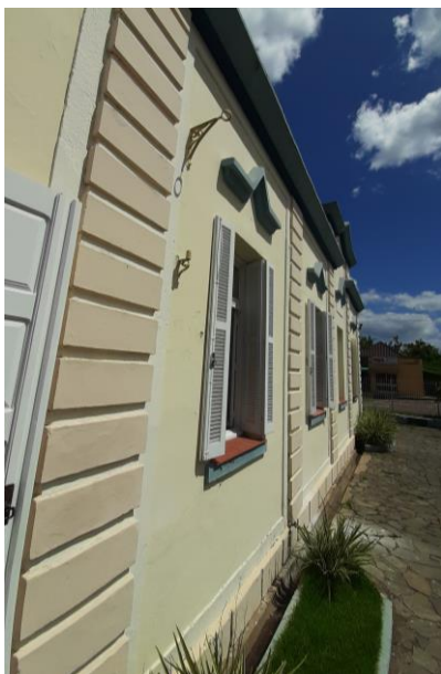
Pilastra com frisos.