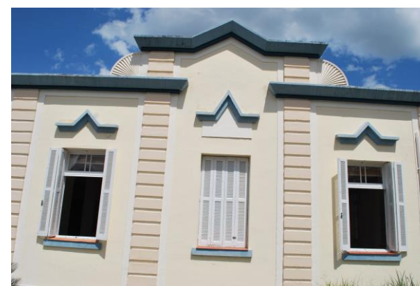
Fachada Oeste. Detalhe das palmetas estilizadas.