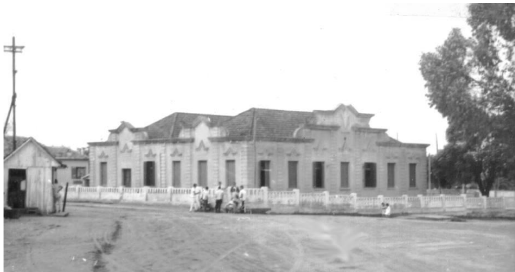
Aspecto do prédio, ainda com balaustrada no alinhamento.