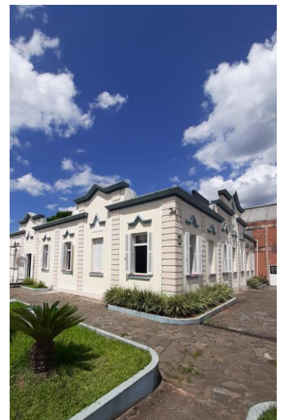
Visual lateral da edificação.