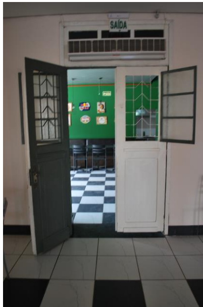
Visual interna, portas de acesso laterais.