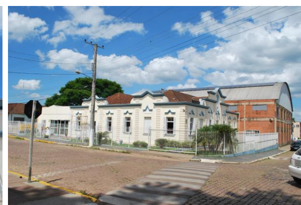
Inserção na rua.