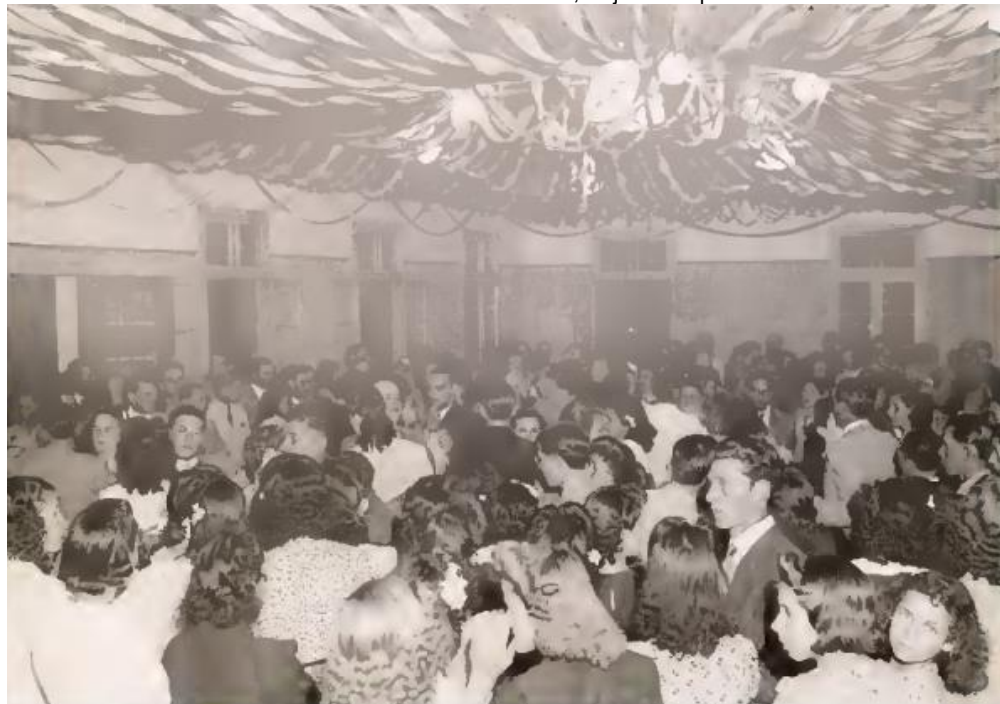
Baile no Clube Última Hora - Década de 1940.