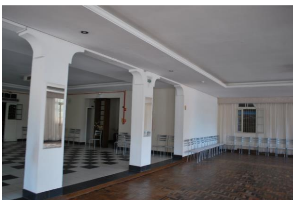
Visual dos pilares no salão interno.