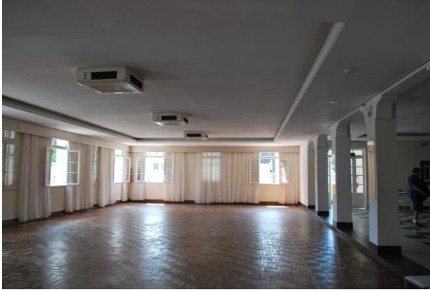
Visual interna do salão.