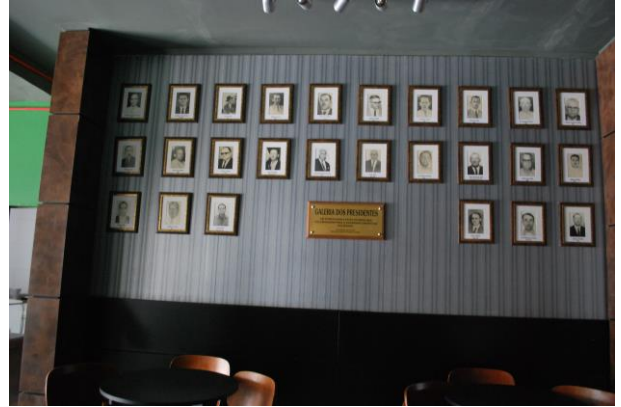
Memorial de Presidentes.