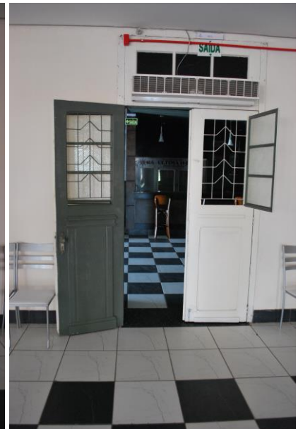
Visual interna, portas de acesso laterais.