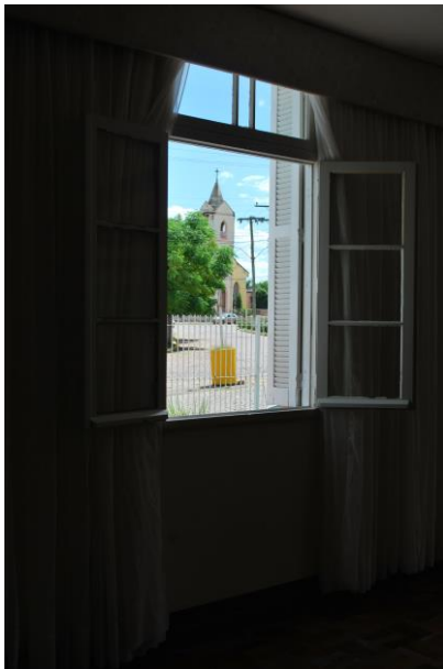
Visual interna, mirada para a Igreja São José.