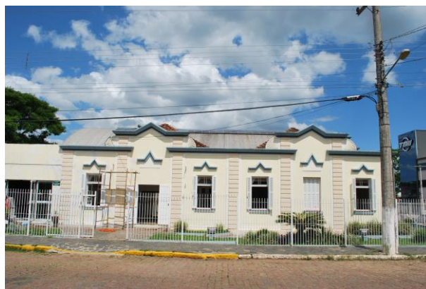
Fachada Oeste. Acesso principal.