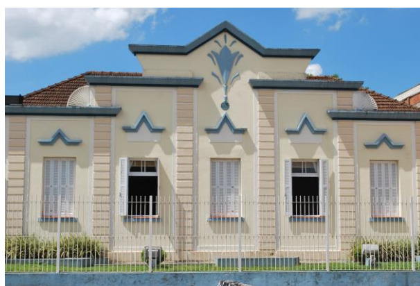
Fachada Sul. Detalhe das pilastras, frisos e frontões.